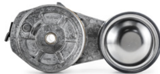
Laturin hihnankiristin asennettuna