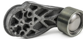
Välihihnapyörän vaihto hihnankiristimen uusinnan yhteydessä