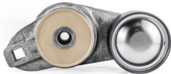
Tuulettimen hihnankiristin asennettuna